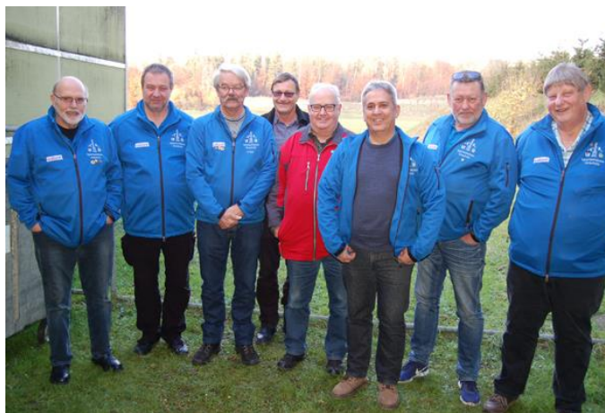
Am Ustertag-Schiessen 2019