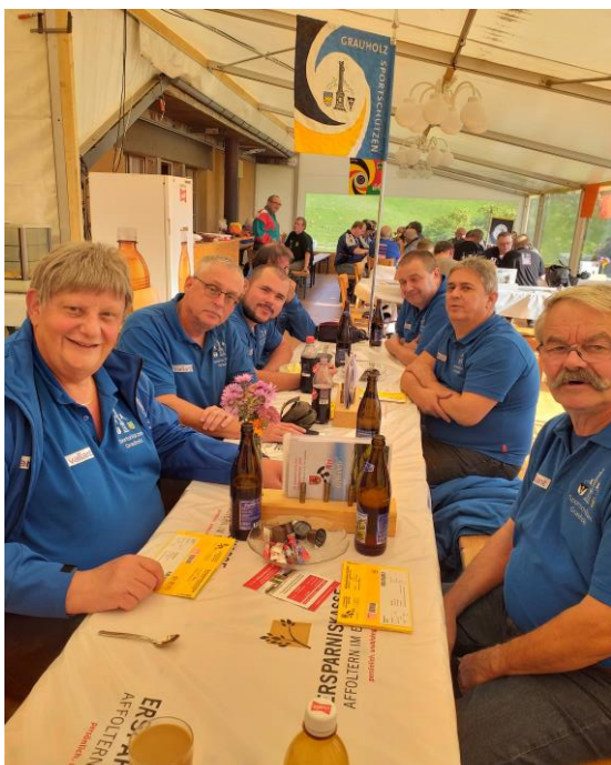
Gemütliches Beisammensein am Emmentalischen Landesschiessen

An der HV der SpS Grauholz können Vereinsjacken und Poloshirt bestellt werden