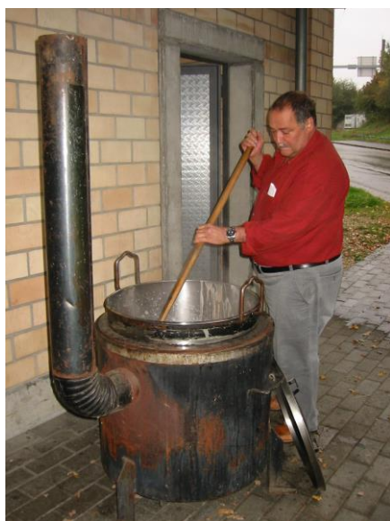
Pot -au-feu 2010