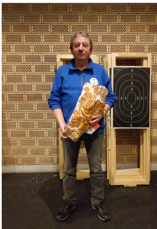
Der Sieger 2021