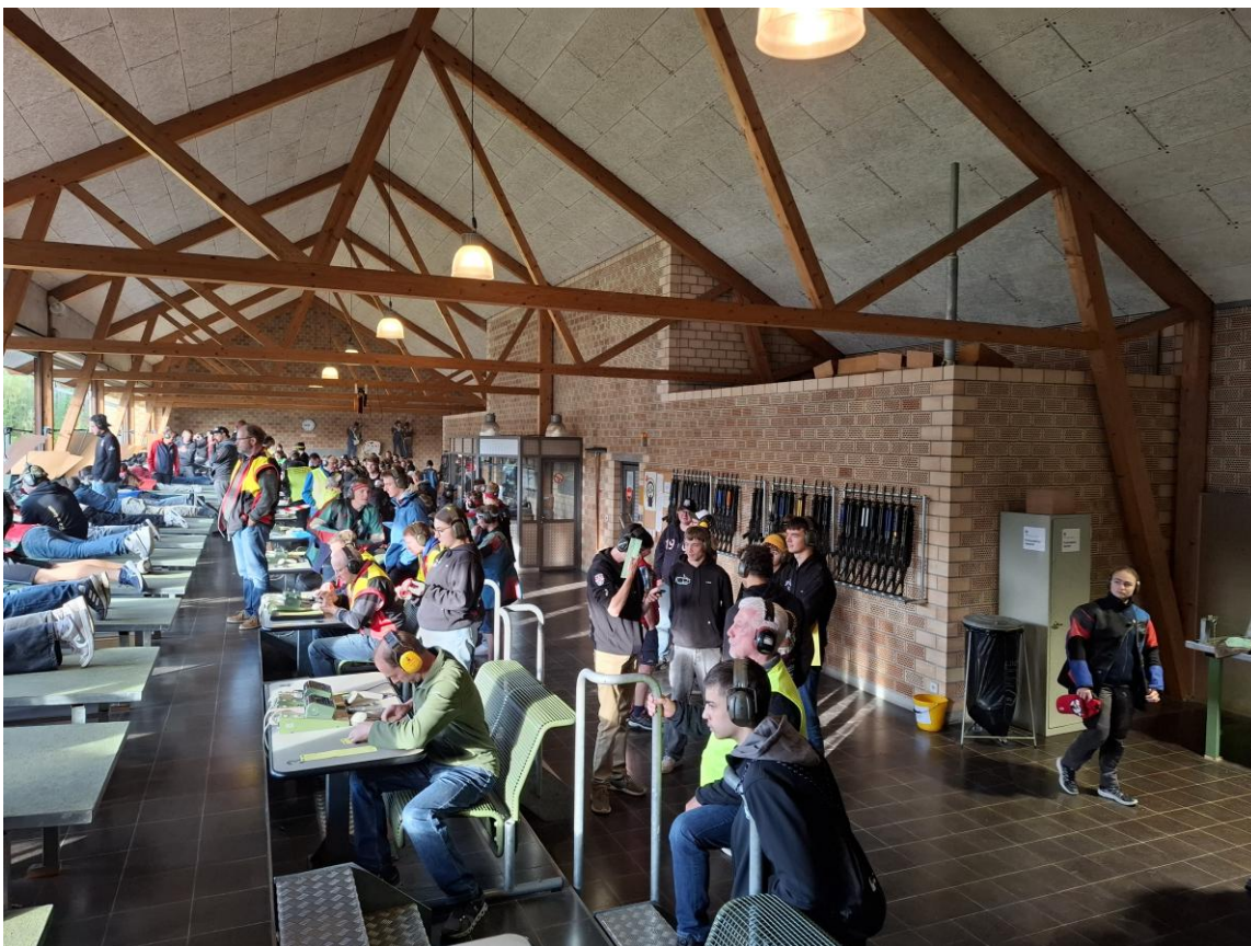
Abbildung 2: 300m-Schiesstand während dem Schiessbetrieb

Die Resultate wurden getrennt nach Nachwuchs- und Jungschützenwettkampf sowie innerhalb dieser Gruppen nach Alter und verwendetem Sportgerät ausgewertet. Bei den 300-Meter Disziplinen konnte eine maximale Punktezahl von 150 Punkten erzielt werden. Für Furore sorgte Salomé-Dorothee Zbinden (MSG Guggisberg), die gleich doppelt triumphierte: Sie gewann mit dem Sturmgewehr über 300 Meter sowohl den Jungschützenwettkampf als auch die Kategorie U21 des Nachwuchswettkampfes. In der Kategorie U17 Gewehr 300 Meter siegte Luana Blum (SG Erlenbach-Wimmis). Das beste Standardgewehr-Resultat erzielte Nick Krebs (Schützen Zweisimmen).